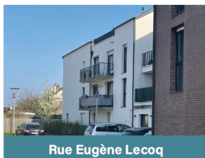
Rue Eugène Lecoq