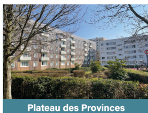
Plateau des Provinces